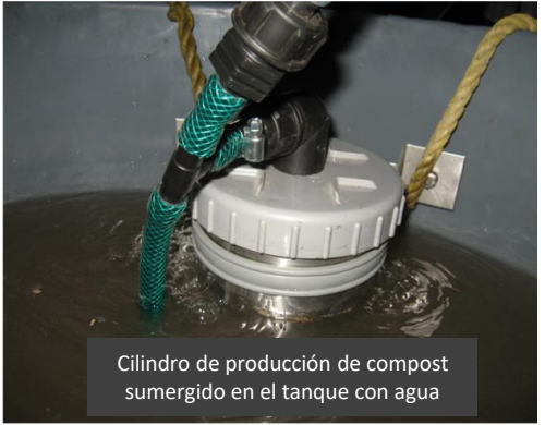
Cilindro de producción de compost sumergido en el tanque con agua